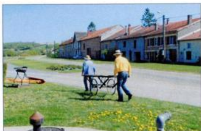
Le brancard des défunts de retour dans l'église.