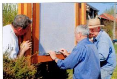
Pose du panneau d'informations.