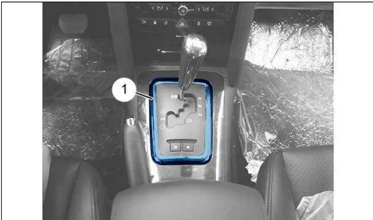
Figure : B2CM121D