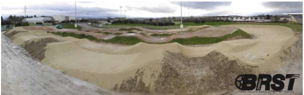
Création de la section PRO

Rappel: Seuls les coureurs figurant sur la LRP 2014 et dont la catégorie fait apparaître la mention « national » sont autorisés à courir.