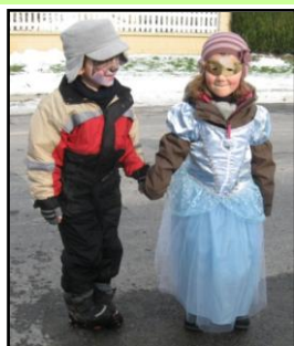
Mardi-Gras dans la neige