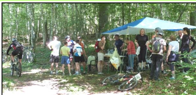
XIII ème rando des Marcassins sous le soleil.

90 vététistes, 60 marcheurs, 15 cavaliers et calèches étaient au rendez-vous. 80 personnes ont terminé la journée autour du traditionnel barbecue.