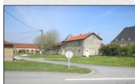
La rue de Coquillard