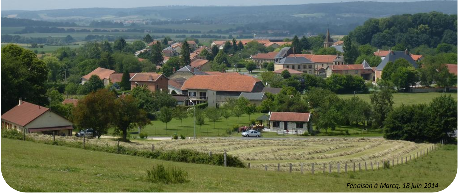
Fenaison à Marcq, 18 juin 2014