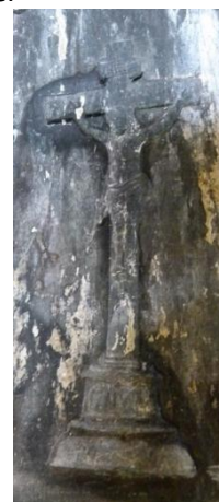
Quelques motifs sur la cloche de notre église