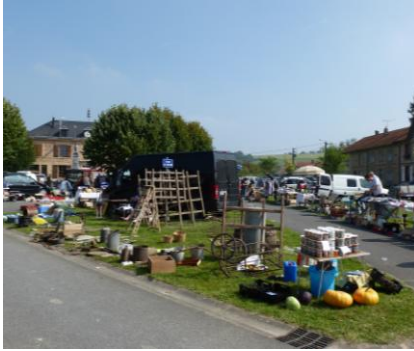
35 exposants installés sur la place

L'ambiance était très bon enfant pour ce 3 ème vide-greniers organisé par Marcq Animation.