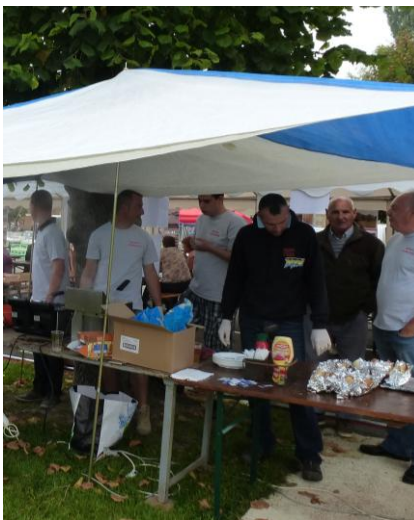
Ah... ! La cuisson des 30 kg de frites... Toute une aventure !!!