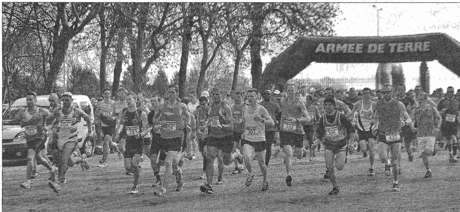
■ La course lunévilloise a connu une érosion en terme de participation.