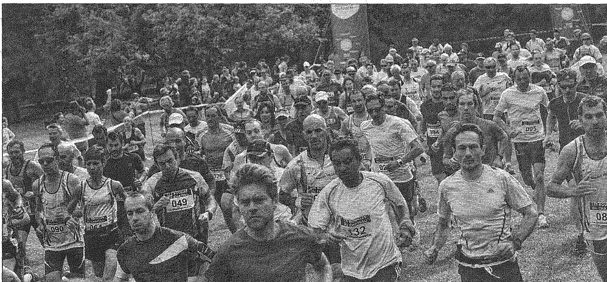
■ Près de 150 participants étaient présents au départ du 10km.