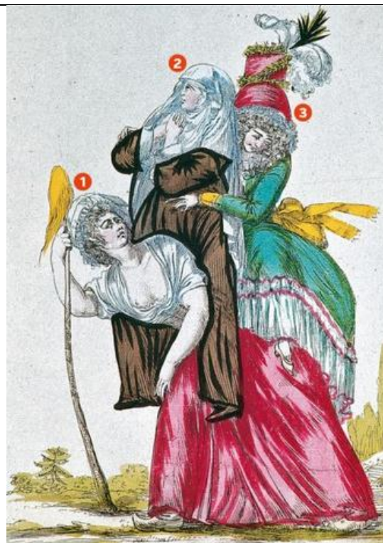
La société d'ordres