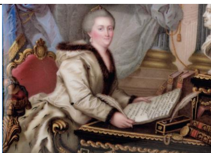
Catherine II tenant le manuscrit de son Nakaz, anonyme russe, vers 1770, musée de l'Ermitage, Saint-Petersbourg

Jusqu'ici je n'ai point distingué les états, les rangs, les fortunes [...] parce que l'homme est le même dans tous les états ; que le riche n'a pas l'estomac plus grand que le pauvre et ne digère pas mieux que lui ; que le maître n'a pas les bras plus longs ni plus forts que ceux de son esclave ; qu'un grand 1 n'est pas plus grand qu'un homme du peuple. [...]