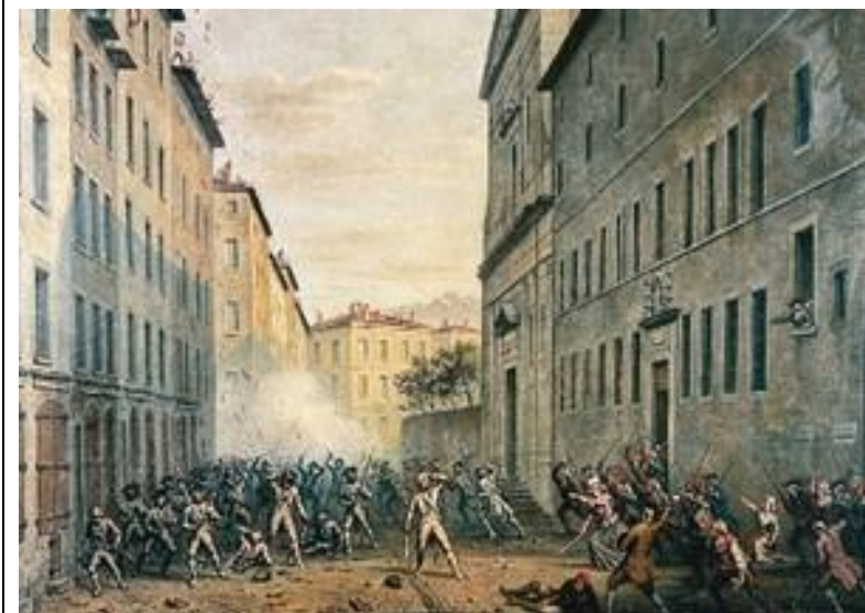
La journée des tuiles à Grenoble, le 7 juin 1788, Alexandre Debelle, 1890, 150x200cm, musée de la Révolution française, Vizille