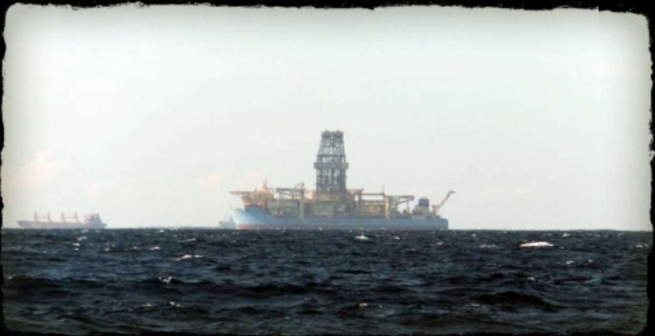
En route pour La Colombie, slalom pour commencer.