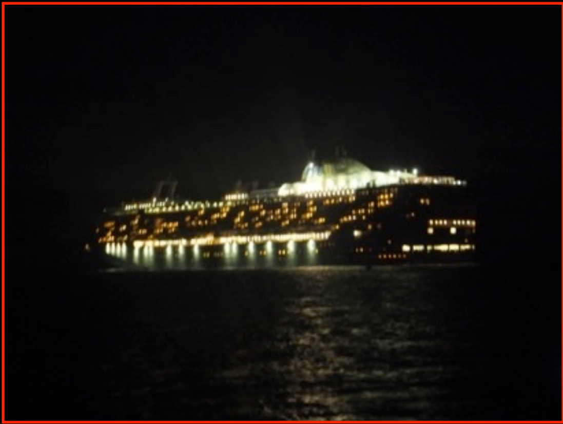
Départ d'un paquebot