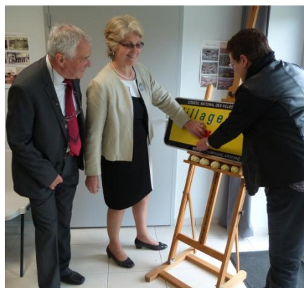
Collage de la fleur sur le 2 ème panneau.