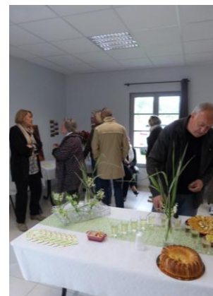
Verre de l'amitié