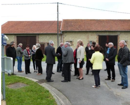
Une partie des invités dans l'attente du collage de la fleur sur le 1 er panneau.