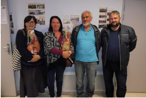
Les gagnants du 23 septembre