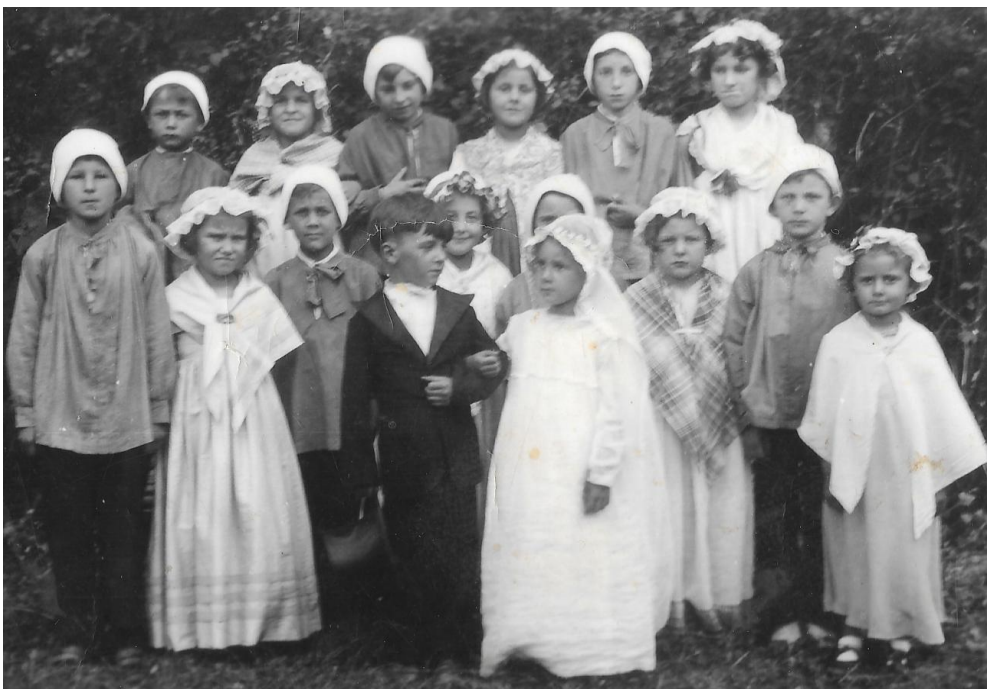
PHOTO DU FAUX MARIAGE, SUITE